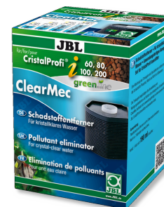
JBL ClearMec CristalProfi i60/80/100/200 Éliminateur de nitrites, nitrates, phosphates pour CPI