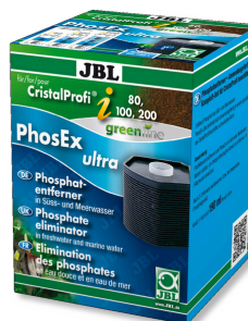
JBL PhosEx Ultra CristalProfi i60/80/100/200 Cartouche de produit antiphosphate pour CristalProfi