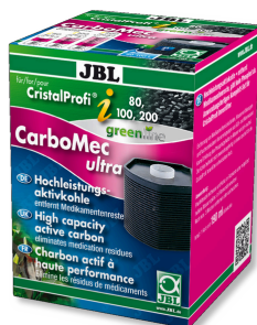
JBL CarboMec ultra CristalProfi i60/80/100/200 Cartouche de charbon actif pour série CristalProfi i