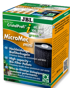
JBL MicroMec CristalProfi i60/80/100/200 Billes de filtration performantes pour CristalProfi