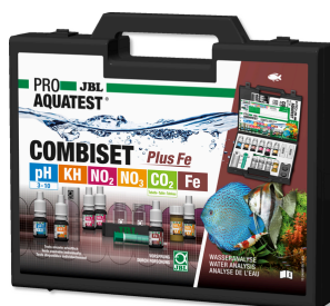
JBL PROAQUATEST COMBISET Plus Fe Testkoffer mit den wichtigsten Wassertests + Eisentest