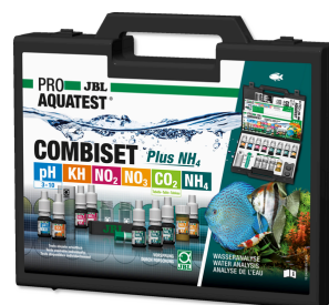
JBL PROAQUATEST COMBISET Plus NH4 Testkoffer mit den wichtigsten Wassertests + NH4-Test