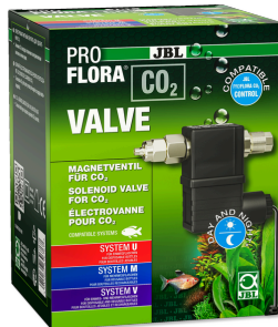
JBL PROFLORA CO2 VALVE CO2-Magnetventil für die kontrollierte CO2 Zugabe