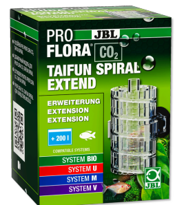
JBL PROFLORA CO2 TAIFUN SPIRAL EXTEND Erweiterung für JBL PROFLORA CO2 TAIFUN SPIRAL 5 / 10