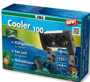
JBL Cooler 100 Вентилятор для пресноводных и морских аквариумов