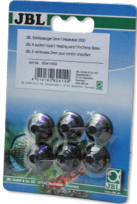
JBL slit suction cup, 2 MM

Для крепления термокабеля в аквариумах и террариумах