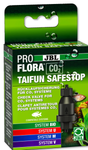
JBL PROFLORA CO2 TAIFUN SAFESTOP Защита от обратного тока воды для установок CO2