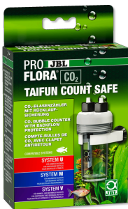
JBL PROFLORA CO2 TAIFUN COUNT SAFE Счетчик пузырьков CO2 со встроенным обратным клапаном