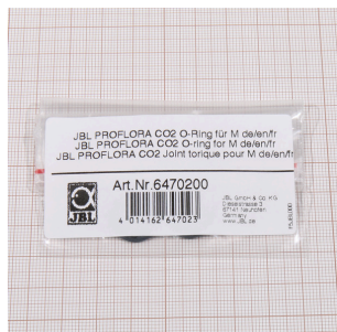
JBL PROFLORA CO2 уплотн. кольцо для M