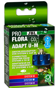
JBL PROFLORA CO2 ADAPT U - M Адаптер CO2 д/переоснащ. с одно- на многогаз. баллоны