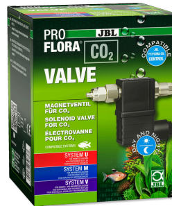
JBL PROFLORA CO2 VALVE Магнитный вентиль CO2 для контролируемой подачи CO2