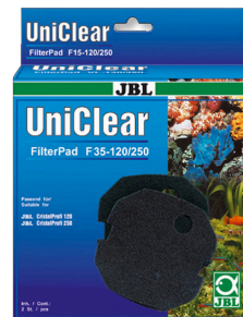
JBL FilterPad F35 Mousse fine pour filtre d'aquarium CristalProfi