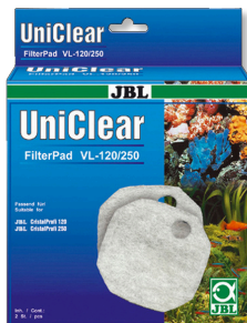
JBL FilterPad VL Ouate filtrante pour filtre d'aquarium CristalProfi