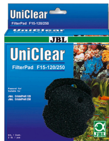
JBL FilterPad F15 Mousse grossière pour filtre d'aquarium CristalProfi