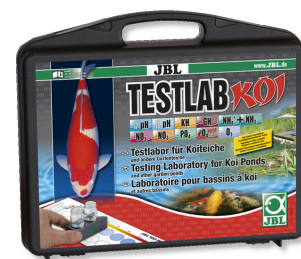
JBL Testlab Koi Coffret de tests professionnel pour bassins