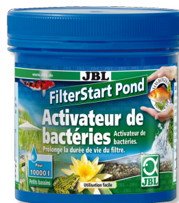
JBL FilterStart Pond Activateur de bactéries pour filtre de bassin