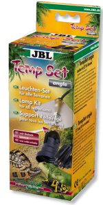
JBL TempSet angle Kit d'installation pour spot de terrarium