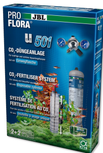
JBL PROFLORA u501 Système de fertilisation des plantes en kit complet