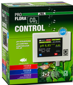
JBL PROFLORA CO2 CONTROL Ordinateur de mesure et de contrôle de CO2 & pH