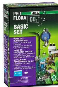
JBL PROFLORA CO2 BASIC SET V Kit CO2 pour plantes d'aquarium SANS BOUTEILLE