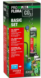
JBL PROFLORA CO2 BASIC SET U Kit CO2 de base complet pour plantes d'aquarium