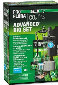
JBL PROFLORA CO2 ADVANCED BIO SET Kit bio CO2 pour aquariums d'eau douce de 40 à 110 l