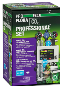
JBL PROFLORA CO2 PROFESSIONAL SET V Kit CO2 avec contrôleur de CO2 / SANS BOUTEILLE