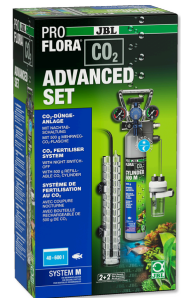
JBL PROFLORA CO2 ADVANCED SET M Kit complet de fertilisation au CO2 + coupure nocturne