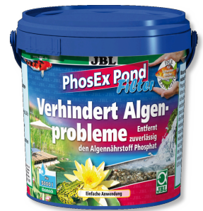
JBL PhosEx Pond Filter Eliminador de fosfatos para filtros de estanque