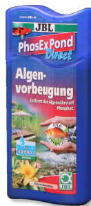
JBL PhosEx Pond Direct Eliminador de fosfatos para el estanque