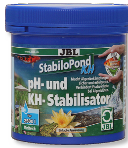
JBL StabiloPond KH Estabilizador del pH para estanques de jardín