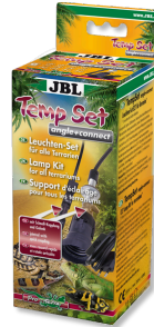
JBL TempSet angle+ connect Installation kit for lamps in terrariums