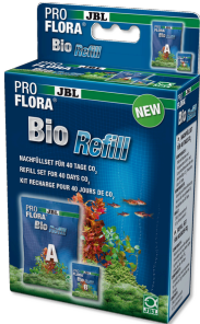
JBL PROFLORA BioRefill Recharge pour systèmes de fertilisation bio au CO2