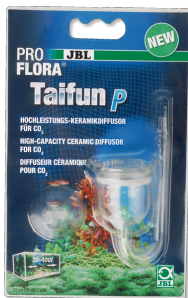
JBL PROFLORA Taifun P Mini-diffuseur de CO2 pour nano-aquarium d'eau douce