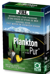
JBL PlanktonPur MEDIUM Lekkernij voor grote aquariumvissen