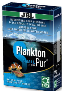
JBL PlanktonPur SMALL Lekkernijen voor kleine aquariumvissen