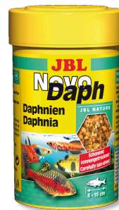
JBL NovoDaph Watervlooien, lekkernijen voor aquariumvissen