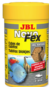
JBL NovoFex Tubifexblokjes. Lekkernij voor aquariumvissen