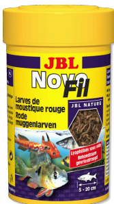
JBL NovoFil Rode muggenlarven voor kieskeurige aquariumvissen