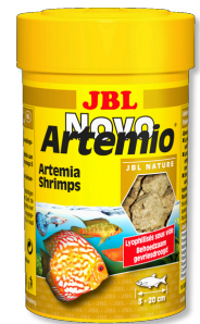
JBL NovoArtemio Aanvullend artemiavoer voor alle aquariumvissen