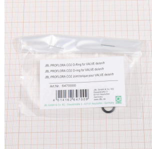
JBL PF CO2 o-ring voor VENTIEL