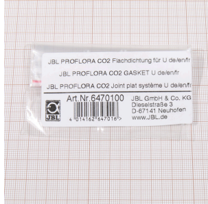
JBL PF CO2 platte dichtung voor U