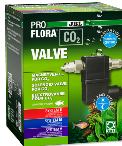
JBL PROFLORA CO2 VALVE CO2 magneetventiel voor een gecontroleerde CO2 toevoer