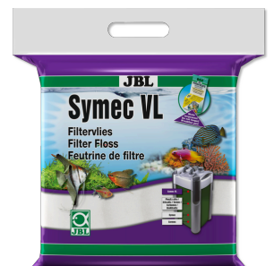
JBL Symec VL Filtro de algodón para eliminar todo enturbiamiento