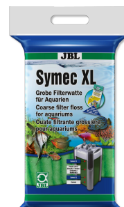
JBL Symec XL Algodón filtrante grueso contra todo enturbiamiento