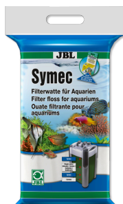
JBL Symec Algodón filtrante p. eliminar cualquier enturbiamiento