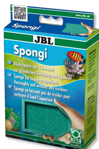
JBL Spongi Gąbka do czyszczenia do akwariów i terrariów