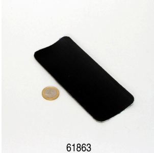
JBL Floaty Pad