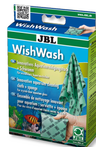
JBL WishWash Ścierka do czyszczenia i gąbka