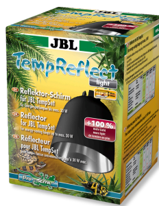
JBL TempReflect light Klosz-odbłyśnik do żarówek energooszczędnych