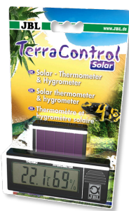
JBL TerraControl Solar Termometr solarny i higrometr do wszystkich terrariów