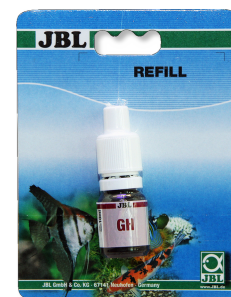
JBL Teste de GH Teste rápido para determinação da dureza total