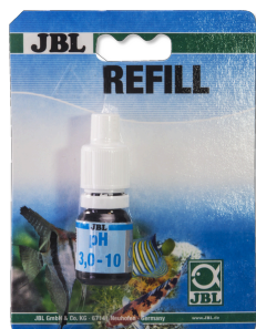
JBL Teste de pH 3,0-10,0 Teste rápido para determinação do teor de ácido