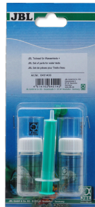
JBL Kit de peças para testes de água

Paletas de cores para testes de água da JBL