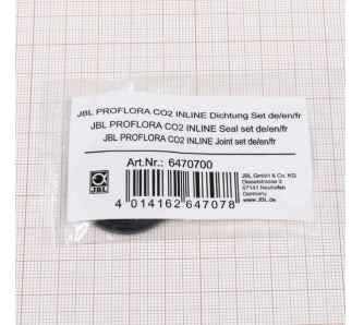
JBL PF CO2 INLINE Kit de vedação