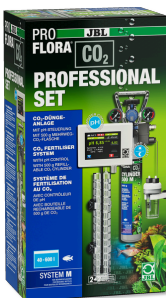
JBL PROFLORA CO2 PROFESSIONAL SET M Kit de fertilisation au CO2 avec régulateur de CO2