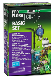
JBL PROFLORA CO2 BASIC SET V Kit CO2 pour plantes d'aquarium SANS BOUTEILLE