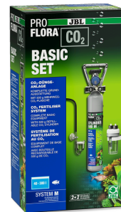
JBL PROFLORA CO2 BASIC SET M Kit CO2 de base complet pour plantes d'aquarium