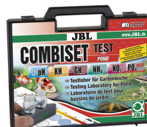
JBL Test Combi Set Pond Наиболее важные тесты для прудовой воды