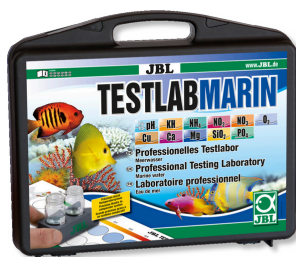
JBL Testlab Marin Чемоданчик с профессиональными тестами морской воды