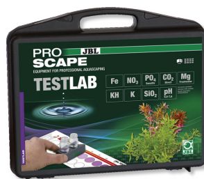
JBL Testlab ProScope Чемоданчик с тестами для растительных аквариумов