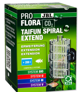
JBL PROFLORA CO2 TAIFUN SPIRAL EXTEND Расширение для JBL PROFLORA CO2 TAIFUN SPIRAL 5 / 10