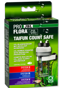
JBL PROFLORA CO2 TAIFUN COUNT SAFE Счетчик пузырьков CO2 со встроенным обратным клапаном