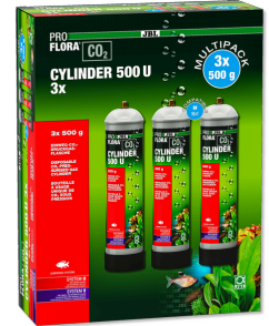
JBL PROFLORA CO2 CYLINDER 500 U 3x Запасной одноразовый баллон 500 г CO2 (упаковка 3 шт.)