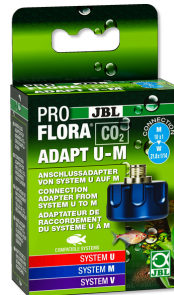
JBL PROFLORA CO2 ADAPT U - M Адаптер CO2 д/переоснащ. с одно- на многораз. баллоны