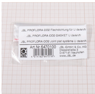
JBL PF CO2 плоское уплотнение для U