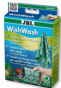
JBL WishWash Panno e spugna per la pulizia