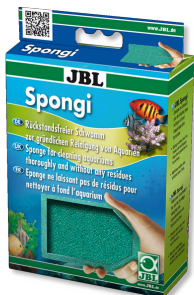
JBL Spongi Spugna per la pulizia di acquari e terrari