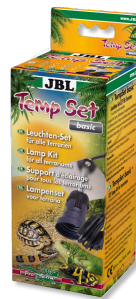
JBL TempSet basic Kit di installazione per faretto da terrari