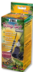
JBL TempSet connect Kit di installazione con connettore