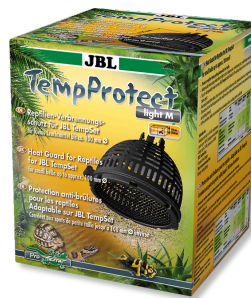
JBL TempProtect light Protezione ustioni per rettili per JBL TempSets