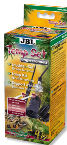
JBL TempSet angle+ connect Kit di installazione per faretto da terrari