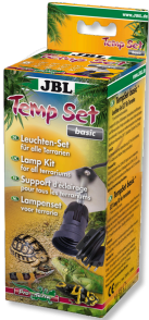
JBL TempSet basic Kit d'installation pour spot de terrarium