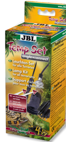
JBL TempSet angle+connect Kit d'installation pour spot de terrarium