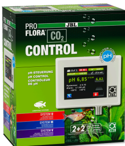
JBL PROFLORA CO2 CONTROL Ordinateur de mesure et de contrôle de CO2 & pH