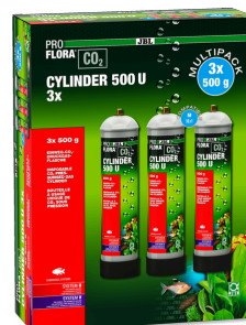
JBL PROFLORA CO2 CYLINDER 500 U 3x Bouteille de CO2 à usage unique, 500 g (pack de 3)