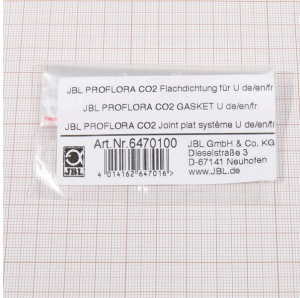
JBL PF CO2, joint plat pour U