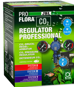
JBL PROFLORA CO2 REGULATOR PROFESSIONAL Détendeur pour CO2 avec 2 manomètres et électrovanne