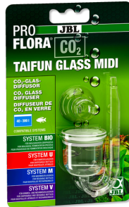
JBL PROFLORA CO2 TAIFUN GLASS Diffuseur de CO2 en verre pour aquarium de 40 à 300 l