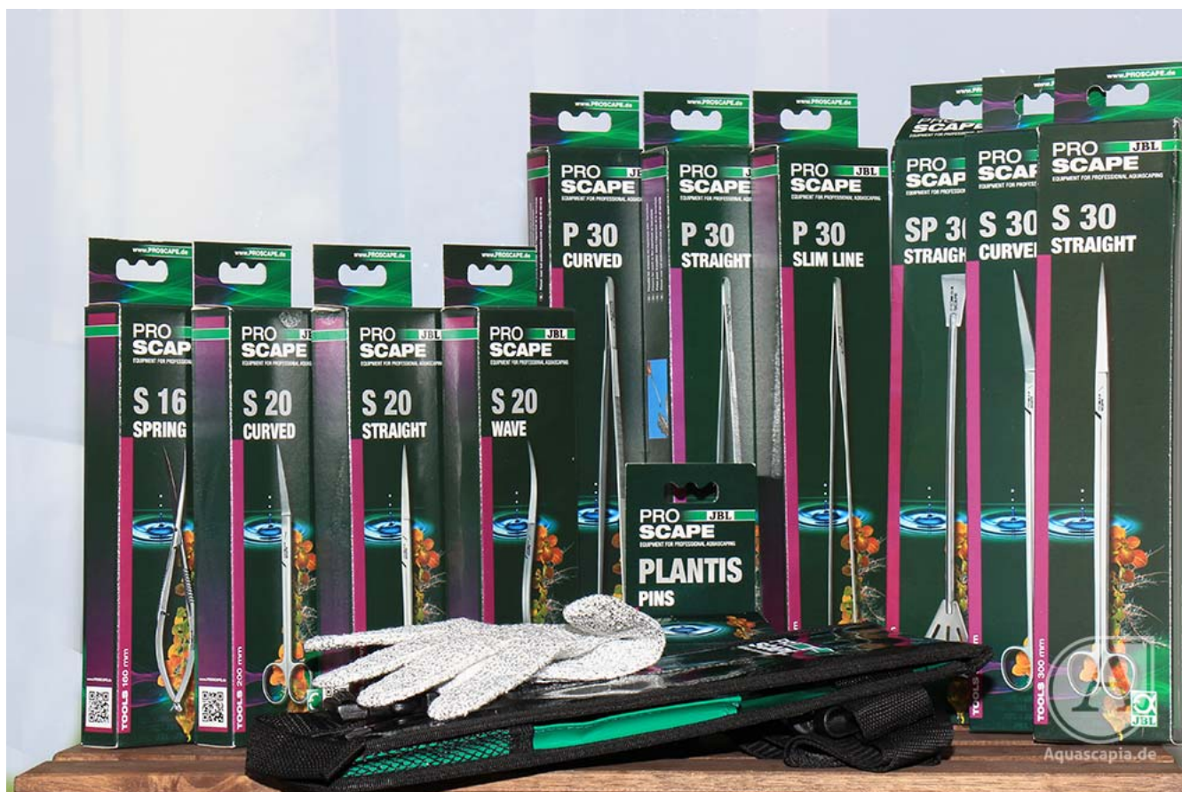
JBL ProScape Tools in der Übersicht

Außerdem erfahrt Ihr, wie Ihr kostenlos einen JBL ProScape Toolbag abstaubt!