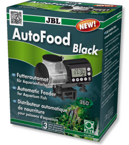
JBL AutoFood BLACK Akvaryum balıkları için siyah yem otomati