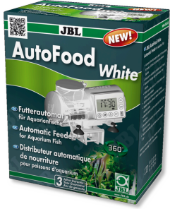
JBL AutoFood WHITE Akvaryum balıkları için beyaz yem otomati