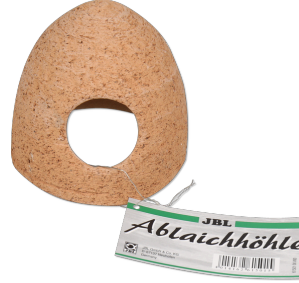
JBL Keramik Yumurtalama Mağarası Tatlı su akvaryumları için seramik kovuk