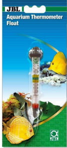
JBL Akvaryum termometresi, yüzen Akvaryum termometresi