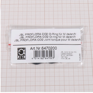
JBL PROFLORA CO2 M için O halka