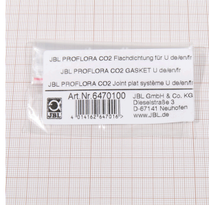
JBL PF CO2, U için düz conta