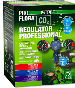
JBL PROFLORA CO2 REGULATOR PROFESSIONAL CO2 için 2 gösterg. ve solen. valfli basınç regülatörü