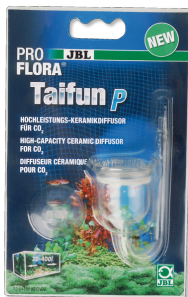
JBL ProFlora Taifun P Миниатюрный CO2-диффузор для пресноводных аквариумов