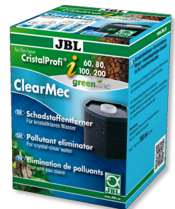
JBL ClearMec CristalProfi i60/80/100/200 Éliminateur de nitrites, nitrates, phosphates pour CPI