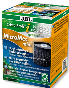
JBL MicroMec CristalProfi i60/80/100/200 Billes de filtration performantes pour CristalProfi