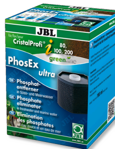
JBL PhosEx Ultra CristalProfi i60/80/100/200 Cartouche de produit antiphosphate pour CristalProfi