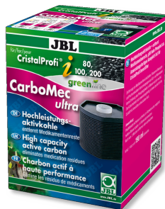
JBL CarboMec ultra CristalProfi i60/80/100/200 Cartouche de charbon actif pour série CristalProfi i