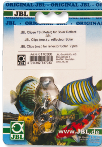
JBL Clips T5/T8 (Métal) Fixation en métal pour tubes fluorescents