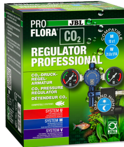
JBL PROFLORA CO2 REGULATOR PROFESSIONAL Détendeur pour CO2 avec 2 manomètres et électrovanne