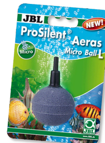
JBL ProSilent Aeras Micro Ball L