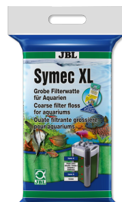
JBL Symec XL Hrubá kvalitní filtrační vata na jakékoli zakalení