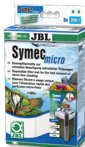
JBL SymecMicro Vlies z mikrovlákna do akv. filtrů proti zakalení