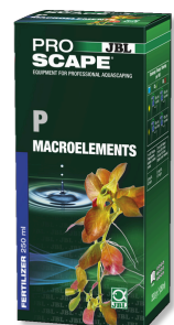
JBL PROSCAPE P MACROELEMENTS Phosphor-Pflanzendünger für Aquascaping