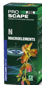
JBL PROSCAPE N MACROELEMENTS Stickstoff-Pflanzendünger für Aquascaping