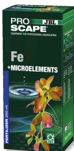
JBL PROSCAPE Fe + MICROELEMENTS Basis Pflanzendünger für Aquascaping