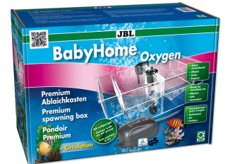
JBL BabyHome Oxygen Premium-Abiaichkasten- Komplettset mit Luftpumpe