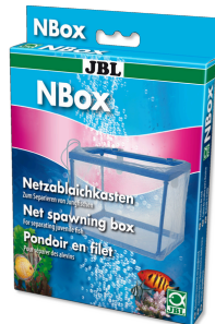
JBL NBox Netzablaichkasten für Aquarienfische