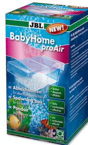
JBL BabyHome proAir Abiaichkasten für Sprudelsteininstallation