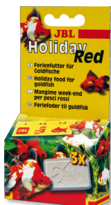
JBL Holiday Red Ferien-Alleinfutter für Goldfische