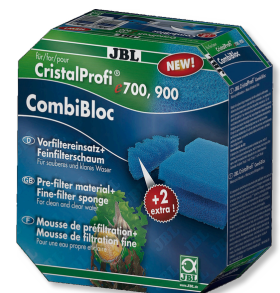
JBL CombiBloc CristalProfi e Vorfiltereinsätze und Schaum für CristalProfi e