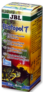
JBL Biotopol T Wasseraufbereiter für Terrarien