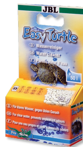
JBL EasyTurtle Spezialgranulat zur Beseitigung von Gerüchen