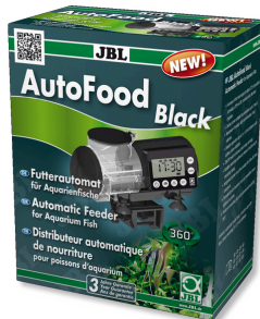
JBL AutoFood BLACK Schwarzer Futterautomat für Aquarienfische