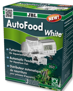
JBL AutoFood WHITE Weißer Futterautomat für Aquarienfische