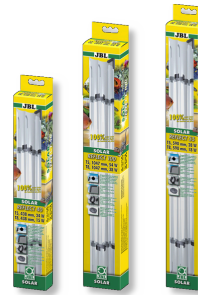
JBL SOLAR Reflect T5/ T8 - 895-1500 mm Reflektorblech für Solar- Leuchtstoffröhre