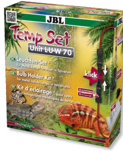
JBL TempSet Unit L-U-W Installationsset für Metalldampfstrahler (LUW und HQI)